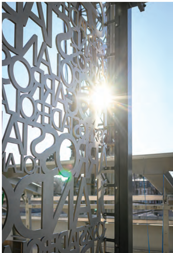
Habillage extérieur du court Philippe-Chatrier.