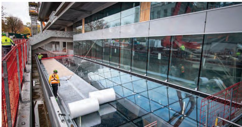
Verrière du nouveau centre des médias.

Afin de s'intégrer harmonieusement sur le site de Roland-Garros et de rester le plus discret possible, des mâts rétractables ont été installés autour du court 14 et sont actuellement en phase de test. Ces mâts de 3,50 mètres se déploieront pour atteindre 15 mètres de haut et éclairer ainsi le court 14 lors du prochain tournoi de Roland-Garros. Trois autres courts seront munis d'un dispositif d'éclairage : le Suzanne-Lenglen, le Simonne-Mathieu et le Philippe-Chatrier. À noter que le toit de ce dernier et les projecteurs seront bien indépendants l'un de l'autre et que les courts ne seront éclairés qu'en cas de matchs qui se prolongeraient après la tombée de la nuit et aucunement pour des sessions de soirée.