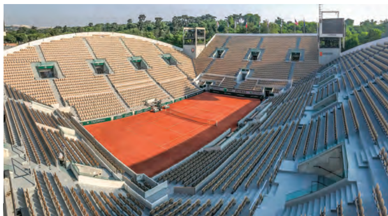
Le court Suzanne-Lenglen.

Livraison du Jardin des Mousquetaires et des espaces paysagers.