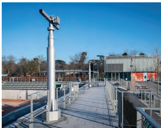
Mâts rétractables autour du court 14.