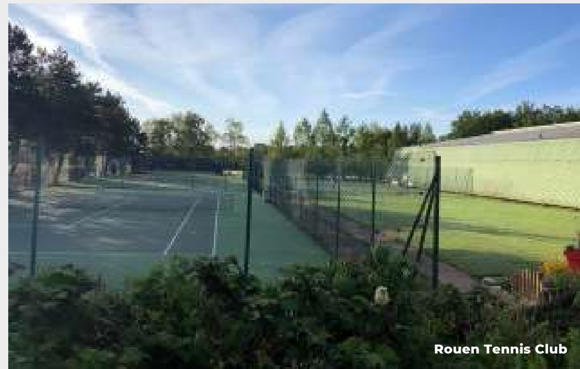
Rouen Tennis Club