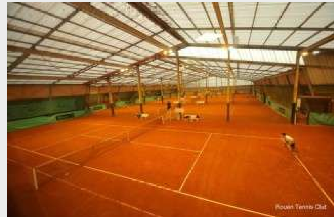
Rouen Tennis Club