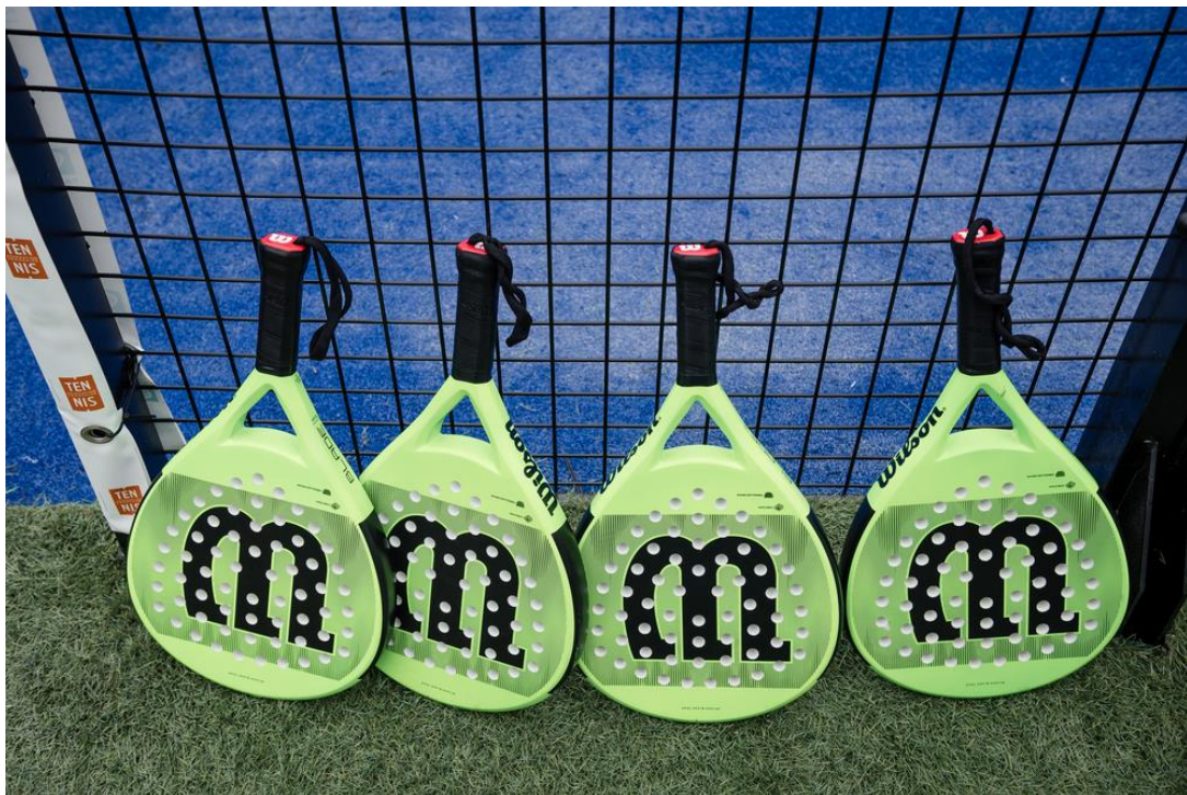
Photo téléchargeable libre de droits

Le décompte des points est le même qu'au tennis : il faut 6 jeux pour gagner un set et 2 sets pour remporter la partie. Le service se joue à la cuillère , avec deux tentatives et, s'il n'y a droit qu'à un rebond de la balle au sol lors de l'échange, il est possible de frapper celle-ci après un rebond sur n'importe quelle autre surface.