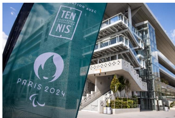
Photo téléchargeable libre d'utilisation pour les médias