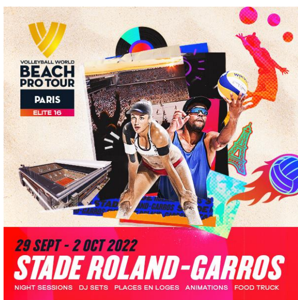
Visuel téléchargeable libre d'utilisation pour les médias

Le stade Roland-Garros accueillera l'étape française de Paris Beach Pro Tour (niveau élite) du 29 septembre au 2 octobre. Cette épreuve promet d'être passionnante avec la présence des 16 meilleures paires féminines et masculines de beach volley au monde ! Un événement qui constitue une magnifique occasion pour le public d'assister à cette discipline spectaculaire, dans une ambiance festive, en venant notamment supporter les équipes de France le jeudi 29 septembre à 20h et le vendredi 30 septembre, à 11h et 20h ! De multiples divertissements seront proposés dans les tribunes entre les points et les matches. Un village « animations » sera également installé tout au long de la compétition dans le Jardin des Mousquetaires.