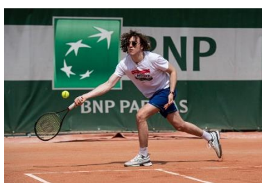
César de Rummel Photo téléchargeable (libre de droits)